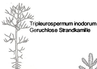
Tripleurospermum inodorum Geruchlose Strandkamille

Ambrosia artemisiifolia , Aufrechte Ambrosie; Anthemis spp., Hundskamille; Matricaria spp., Kamille; Tripleurospermum inodorum , Strandkamille