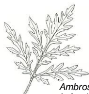
Ambrosia artemisiifolia Aufrechte Ambrosie

Ambrosia artemisiifolia , Aufrechte Ambrosie