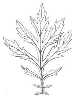
Artemisia vulgaris Gemeiner Beifuss → Abschnitte gezähnt

3 Blätter "zweifarbzig" → oberseits grün, unterseits weiss filzig