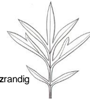
Artemisia verlotiflorum Verlot'scher Beifuss → Abschnitte ganzrandig

3' Blätter beidseitig weissfilzig behaart